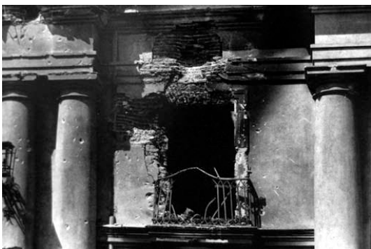
16 sept. 1973

En este contexto adverso, de exterminio, represión y tortura a la totalidad del “cuerpo social” de Chile, fue donde se desarrolló un arte de resistencia a nivel de discurso y de prácticas. Fue un tipo de producción artística que se instaló en la fisura del gobierno de Pinochet, en una zona que le fue imposible de identificar y clasificar al régimen militar. Una zona de movilidad y disidencia dominada por la “subsistencia y el nomadismo” permanente, en medio de un régimen que vigilaba y atemorizaba sistemáticamente a todo el país. En los hechos se desarrolla un activismo político