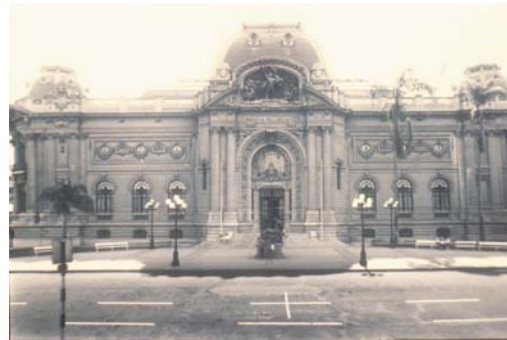
Lotty Rosenfeld, Mil Millas de Cruces, 1979.