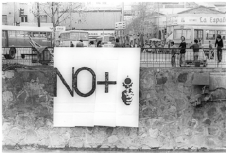
CADA, No +, 1983.

Lotty Rosenfeld (1943) realizó a partir de 1979 la acción urbana “ Una milla de cruces en el pavimento ”. “Este signo se elabora mediante el entrecruzamiento de dos líneas: la primera impuesta por un código de reglamentación social y la segunda propuesta por el arte a modo de subversión y resistencia a una ordenanza pública. Al introducir la “crisis” en el interior de un ordenamiento del tránsito, la obra incita a repensar al ciudadano su situación crítica frente a códigos convencionales, rompiendo así su carácter supuestamente “natural”. En la Documenta Kassel de este año, Rosenfeld presentó su intervención en la vía pública, sin embargo fue desmontada por funcionarios del ayuntamiento de la ciudad el día previo a la inauguración.