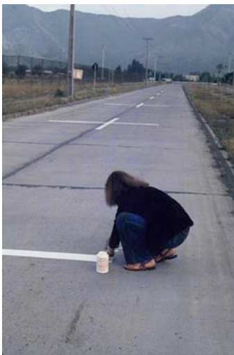
Lotty Rosenfeld. Mil millas de Cruces sobre el Pavimento, Santiago, 1979.