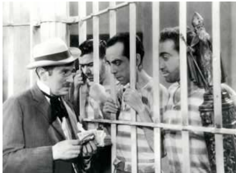
El capital ...