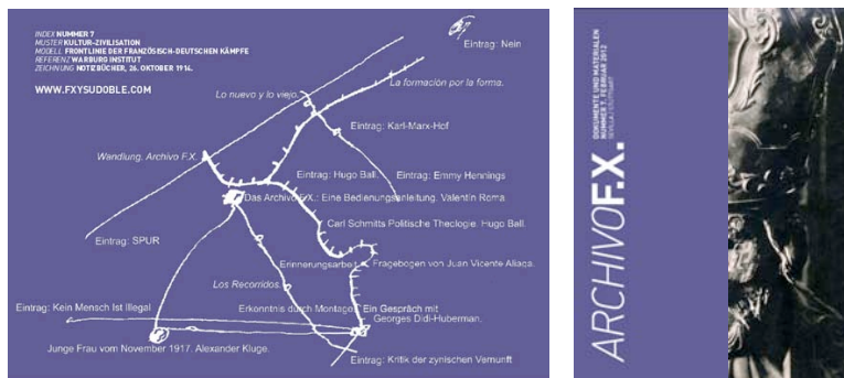
Cover, Archivo F.X., Dokument und Materialien, Nr. 7

Im Rahmen der Ausstellung wurde die siebte Ausgabe der Heftreihe Archivo F.X., Dokumente und Materialien herausgegeben. Sie umfasst Bilder aus verschiedenen Einträgen des Archivo F.X. sowie Texte und Interviews von bzw. mit Pedro G. Romero, Valentín Roma, Georges Didi-Huberman, Alexander Kluge und Hugo Ball. Die Texte sind nur teilweise im Heft abgedruckt. Die Fortsetzungen kann man jeweils auf der Website des Archivo F.X. lesen bzw. herunterladen. Eine Linkangabe sowie ein QR-Code leiten zur entsprechenden Stelle.