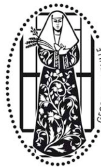
Vorlage für Münzprägemaschine

Entrada: Georges Bataille verknüpft den Namen des französischen Schriftstellers und Philosophen mit dem Bildnis der Jungfrau de la Esperanza von Macarena (Sevilla). Diese wurde 1936 in einer Transportkiste der Banco Español vor den Anarchisten in Sicherheit gebracht. Die für die Ausstellung neu entstandene Installation zu diesem Eintrag besteht in einer Münzprägemaschine, die Fünf-Cent-Stücke in Bildnisse der Heiligen verwandelt.