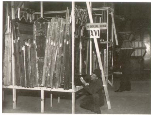
Kritik der zynischen Vernunft

Der 35 Eintrage umfassende Thesaurus Das Alte und das Neue verschrankt wiederum ikonoklastische Ubergriffe, die sich in der katalanischen Stadt Olot ereigneten, mit den Namen bzw. Werken deutschsprachiger KunstlerInnen und Intellektueller aus dem katholischen Suden, wie etwa Hugo Ball, Alfred Kubin, Gerhard Ruhm, Gustav Metzger, Peter Sloterdijk oder Thomas Bernhard. So wird zum Beispiel auf Balls Schrift Zur Kritik der deutschen Intelligenz (1919) verwiesen, in der Ball mit dem Kanon deutscher Geistesgr3en von Luther bis Hegel abrechnet und diesen durch einen eigenen Kanon ersetzt, an dessen Beginn Thomas Muntzer steht.