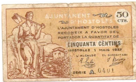
Notice to Guests