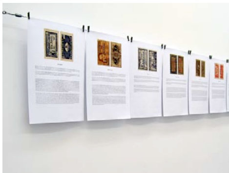
Thesaurus Die uneingestehbare Gemeinschaft (Ausschnitt)