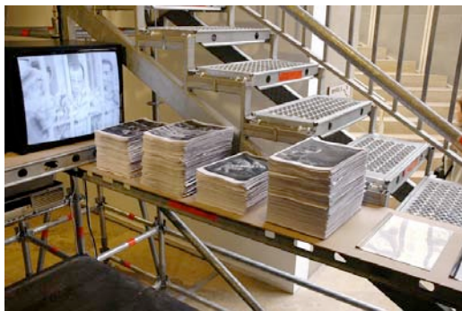
Installation zum Eintrag El Capital...

Die Installation zum Eintrag El Capital ... besteht aus der Monitorpräsentation eines Ausschnitts des Films Nuestro Culpable , bei der ein Drucker live während des gesamten Ausstellungszeitraums jedes einzelne Filmbild der gesamten Sequenz ausdruckt. So wird eine ständig anwachsende Akkumulation von Papierstößen generiert, deren wachsendes Gewicht von einer Waage angezeigt wird.