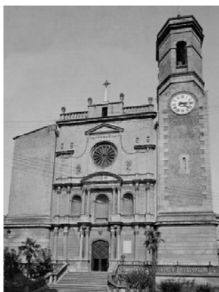
Zur Kritik der deutschen Intelligenz

Auf die genannten Bild-Schlagwort-Kombinationen – die die verschiedenen „Einträge“, das heißt die von Romero so genannten Entradas des Archivo F.X. einleiten – folgen Textfragmente unterschiedlicher Herkunft, die sich abwechselnd auf den im Bild dokumentierten ikonoklastischen Vorfall und den im Schlagwort benannten Autor bzw. Werktitel beziehen. Auf diese Weise entstehen weitere, überraschende und dabei auch widersinnige Assoziationsketten.