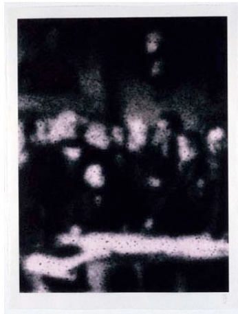
li: The Curiosities of Sigmund Freud (Jubilee Group of the Royal Family)