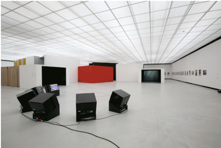
Ausstellungsansicht, Württembergischer Kunstverein, 2008

Das „Postcapital“-Projekt, das erstmals 2006 in der Kunstinstitution La Virreina in Barcelona gezeigt wurde, wird an jedem Ausstellungsort auf andere Weise präsentiert. In Stuttgart ist die Präsentation von einem Ensemble aus begehbaren Raummodulen bestimmt, die von Außen eine aus dem Zentrum verrückte Stadtsilhouette abbilden. Die Dokumente, Video- und Bildmontagen, die darin zu sehen sind, basieren alle auf Andújars digitalem Archiv und fokussieren verschiedene inhaltliche Aspekte. Hinter den Stadtkulissen haben die BesucherInnen Zugriff auf die gesamte Datenbank. Zugleich dient dieser Bereich der Veranstaltung verschiedener Workshops.