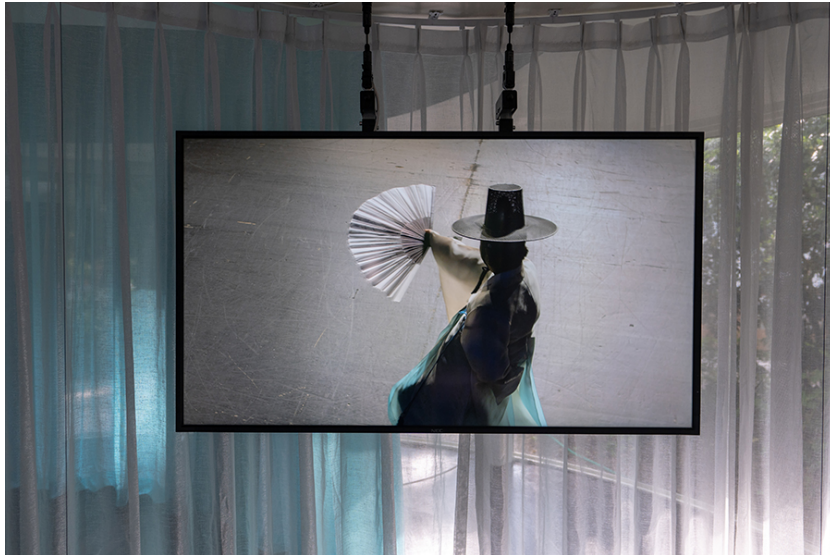
Teil 1, Ausstellungsansicht: Pavillon der Republik Korea, Venedig-Biennale, 2019

Teil 4: 3-Kanal-Video, Full HD, Stereo Sound, 27:36 Minuten